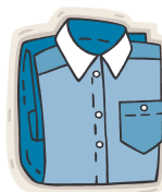
une chem e ise